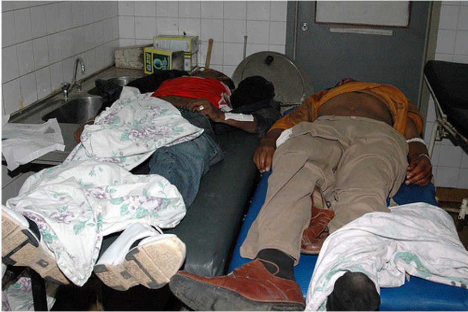
በወጣቶች እና በፖሊሶች መካከል በተደረገው ግጭት የሞቱት. የገነትን ሃሳብ

የኢትዮጵያ የደህንነት ኃይሎች ከተማሪዎች የተቃውሞ ሰልፎች ጋር የተቆራኙትን የኃይል እርምጃዎች በመጠቀም ከልክ ያለፈ ኃይልን ተጠቅመዋል፣ እናም ተቃውሞዎቹን ዛሬ በሂደቱ ራይትስ ዎች ላይ በሂደቱ ራይትስ ዎች ላይ ተከሷል. በኢትዮጵያ የአሜሪካ ዋና ከተማ አዲስ አበባ ዩኒቨርሲቲ የተፈጸመው ጥቃቶች በአርባ አንድ አንድ ወታደሮች ሲሞቱ፣ በመቶዎች የሚቆጠሩ ጉዳቶችን እንዲሁም ከ 2 ሺህ በላይ ተማሪዎችን እና በርካታ የመንግስት ተቺዎች ከታህሳስ 17 ቀን ጀምሮ በእስር ላይ ይገኛሉ. የሰዎች ድምፅ በጥቁር አንበሳ ሆስፒታል፣ የሁለት ወጣት አካላት አካላት፣ አዲስ አበባ፣ ኢትዮጵያ፣