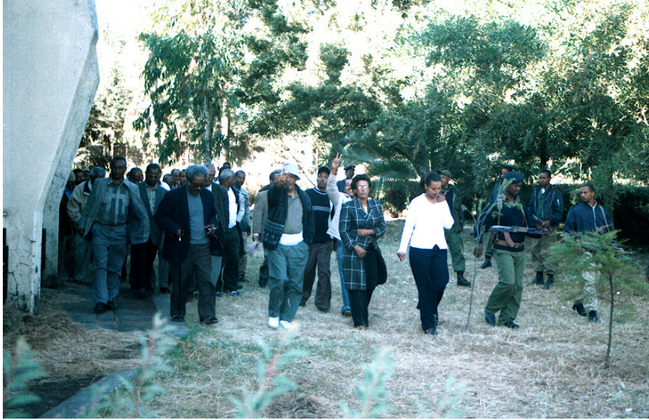
በእስር ላይ, በቅርብ ጊዜ የታገቱ የኪኒይት እስረኞች

በአዲስ አበባ የሚገኙ ተማሪዎች በአዲስ አበባ በተካሄደው የተቃውሞ እንቅስቃሴ የተካፈሉት አንድ ግለሰብ አንድ ላይ ተሰባሰቡ። የእኛ ስቃይ ነው። እንዲሁም በሀገሪቱ ያለውን አሳዛኝ ሁኔታ የሚያሳይ ነው። የቀረው ዓለም ምን እየተደረገ እንዳለ ለመረዳት ይረዳል አዲስ ዛሬ። እነዚህ ፎቶዎች በአሁኑ ጊዜ በኢትዮጵያ ውስጥ የሰብአዊ መብት ድፍጠታዎችን የሚያሳዩ አንዳንድ ማስረጃዎች ናቸው። :