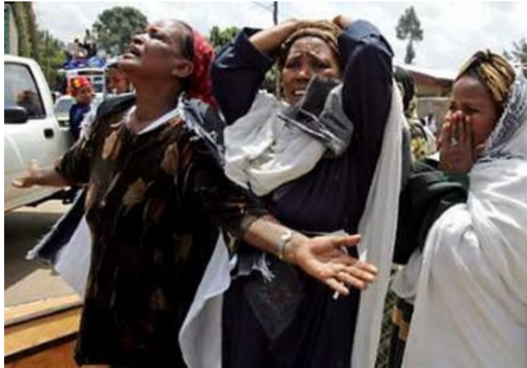
ሁሉም የመንግስት ተቺዎች ለማጭበርበር ሰበብ ነው።

"ለጋሽ ሀገሮች የአቶ መለስን ክንድ ማዛባት እና ማስታረቅ ይችሉ ዘንድ; እስረኞችን ይለቀቁ, ጋዜጦችን እንደገና ይከፍታሉ" ብለዋል. "እነሱ እንደሚሉት ዓይነት ዲሞክራሲን ቢያስቡ ነው."