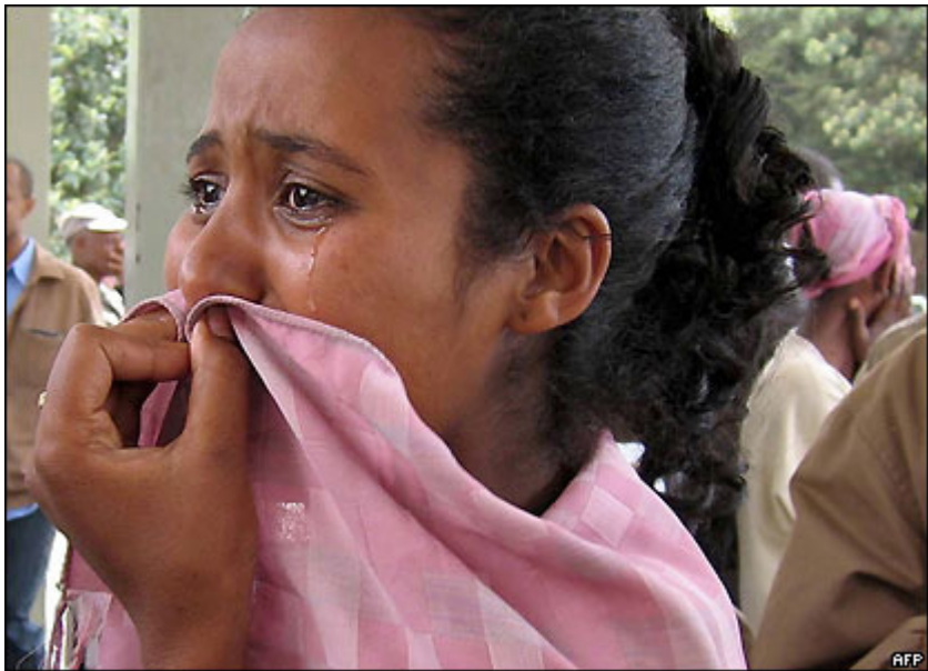
በዙዎቹ ግጭቶች በሜቶ ማራቶን የንግድ አደራጅተው ነበር።