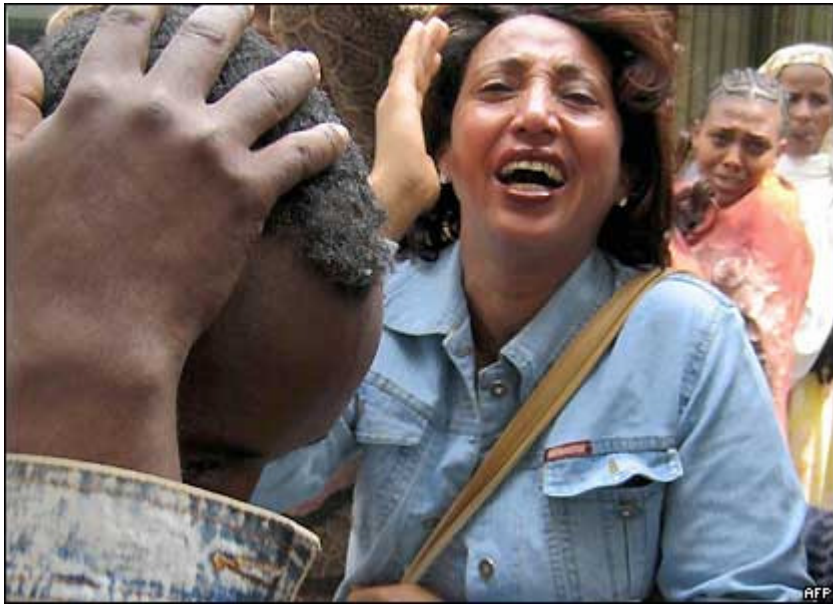
የቆሠሩት ሰዎች ወደ ሆስፒታል ሲወሰዱ አንድ ሴት "የግድያ" ሁኔታ " በማክሰኛ ዓመፅ ውስጥ ስምንት ሰዎች ሲሞቱ ረቡዕ 23 ቀን ነው።