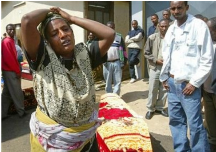
ባልታጠቁ ተማሪዎች ተጨፍጭታዊ በሆነ መንገድ የመንግስት ኃይልን መጠቀሚያ ነው።

Source From Human Rights News የኢትዮጵያ የግዛት ዩኒቨርሲቲ, የሲቪል ማህበረሰብ በሳማን ዞያ-ዛሬ